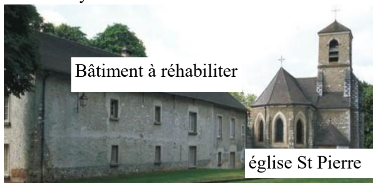
Bâtiment à réhabiliter

P.S. : Dans le cadre de la souscription les versements au nom de « ADECE - Rénovation presbytère de Boussy » vous permettent de recevoir un reçu fiscal. Dès maintenant donnez en ligne sur le site du Diocèse avec le QRCode ci contre ou : https://dons.evry.catholique.fr/chantiers/renovation-des-salles-paroissiales-du-presbytere-de-boussy-saint-antoine/